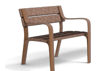
Citizen Eco UM301SPR

+49 (0) 521 450 131-2 | mb@bas-mobilier.de